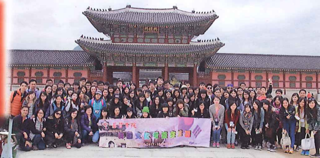
▲師生同到首爾,了解韓國文化及探究全球化課題。