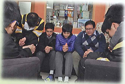
▲校方重視宗教教育，校牧與學生一同祈禱。

近年學校把所持守的教育信念定位為「學生為本、自強為業、感恩為祭」，並見諸於有校本特色的課程，以及各式各樣走出課室的特色活動。如中文科鼓勵學生參加校際朗誦比賽，不論學生表現皆可代表學校參賽，得獎其次學習為先；英文科與生活科技科合作，在校內舉辦烹飪比賽及時裝表演，以全英語進行，務求能讓學生在趣味中學習英文。