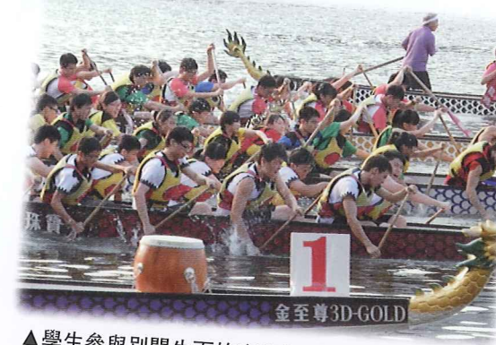
▲學生參與別開生面的班際龍舟比賽